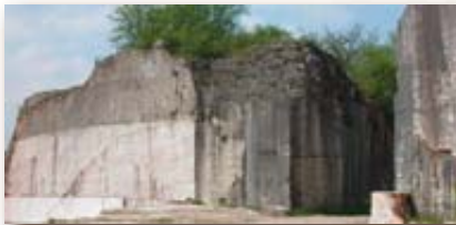
093 - Dévotion de Frasne, Belgique

De nombreuses conférences sont données un peu partout en France sur les divers thèmes de l'Année (voir agenda) on notera en particulier :