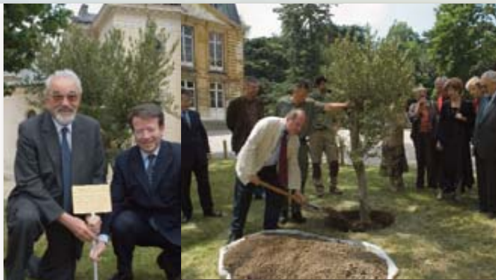
Plantation de l'Olivier AIPT