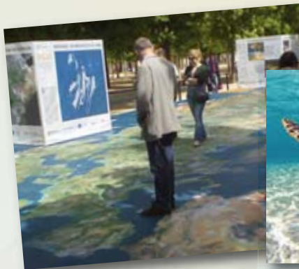
181- Avenir de la Terre, les dés sont ils jetés?

Bibliothèque, Université Orsay, jusqu'au 30 septembre