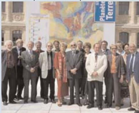
Le comité stratégique AIPT France au MNHN, 11 juin 2008