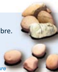
164 - Galets de Galaure