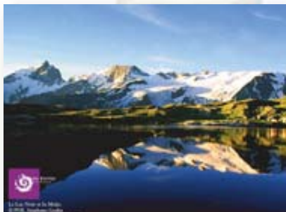
Parc des Ecrins - Lac Noir et la Meije.