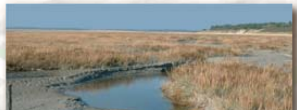
159 - Landes de Versigny

Un massif ancien : le massif armoricain de l'Icartien au Quaternaire.